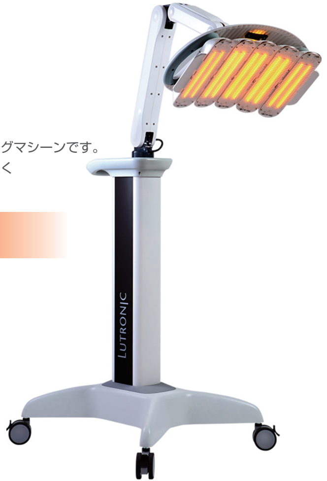
ヒーライト照射：コラーゲン増殖

■諸外国における安全性等に係る情報に関して 諸外国で重篤な安全性情報の報告はありません。