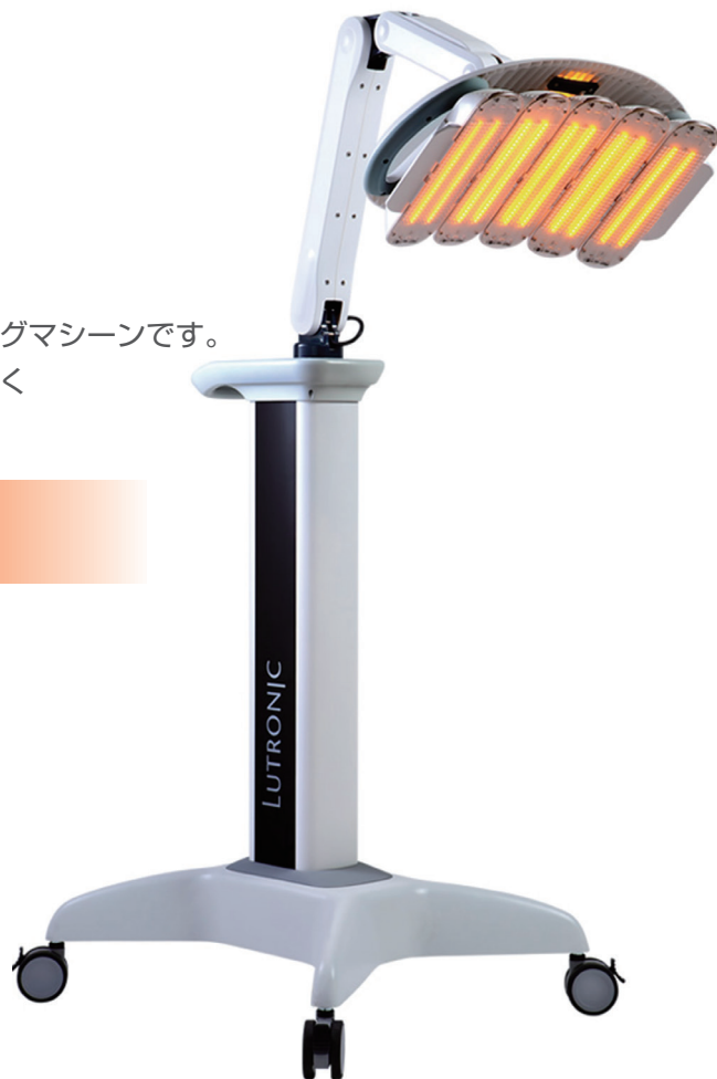
ヒーライト照射：コラーゲン増殖

■諸外国における安全性等に係る情報に関して 諸外国で重篤な安全性情報の報告はありません。